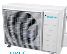
RXLS - Udedel optimeret til drift ned til -25°C